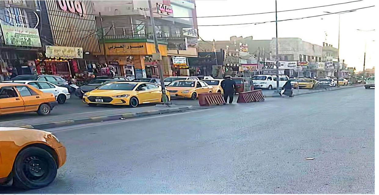
صورة (1) شارع المحافظة في مدينة الكوت

المصدر : التقطت من قبل الباحث بتاريخ 17 / 1 / 2025 .